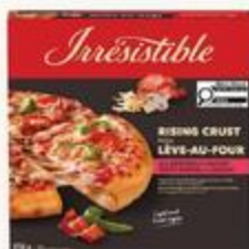
Pizza rebord surélevé Irresistible