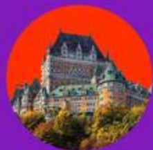
Fairmont un des 2 forfaits pour vivre le grand luxe