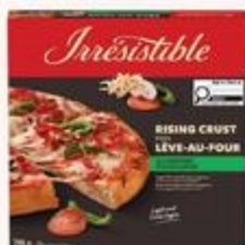
Pizza lève-au-four Irresistible