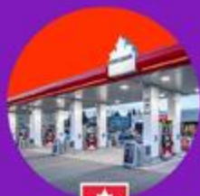
Petro-Canada 10 prix d'essence gratuite pour un an