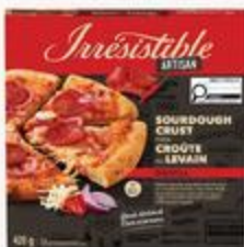
Pizza croûte au levain Irresistible

qu'on aime un peu, beaucoup .....à la folie!