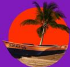
un des 2 séjours au Club Med® Miches Playa Esmeralda