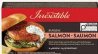
Burgers de saumon Irresistible