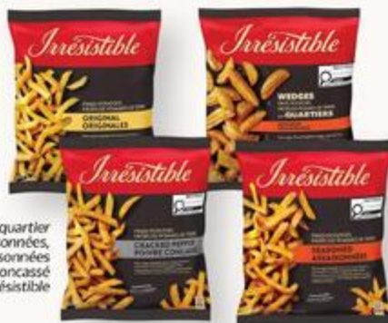
Frites en quartier assaisonnées, originales, assaisonnées ou poivre concassé Irresistible