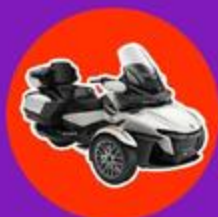
can-am Spyder RT Limited