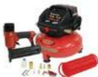
ENSEMBLE DE COMPRESSEUR À AIR SANS HUILE 3 gallons, incluant douilleuse #K42893508