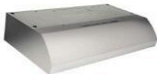
HOTTE SÉRIE BXT Avec inoxydable, 30" #B673355C