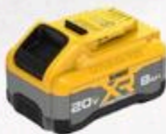
BATTERIE DE 8 AH 20 V MAX XR POWERPACK™ DOR2101