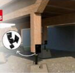
SUPPORT PATIO AJUSTABLE Acier extensible #12050P