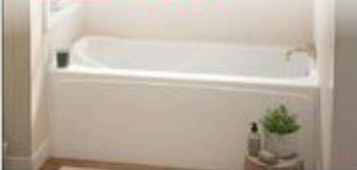
BAIN À JUPE MADDIE Blanc, Drain à droite ou à gauche, 60" x 32" #MA260220/G