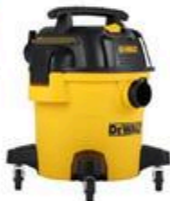
ASPIRATEUR POUR RÉSIDUS SECS ET HUMIDES