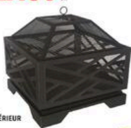
FOYER EXTÉRIEUR LOGAN