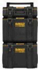
SYSTÈME DE RANGEMENT SUR ROUES TOUGHSYSTEM® 2.0 #D93160438