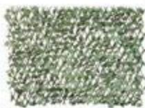
TREILLIS EXTENSIBLE AVEC FEUILLES D'ÉRABLE 72" x 36" #J57945

RABAIS DE 20% 31 20 ch PRIX COURANT 39 99