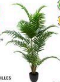
PALMIER 22 FEUILLES 49" #22643

RABAIS DE 15% 38 24 ch PRIX COURANT 44 99