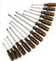
ENSEMBLE DE TOURNEVIS #332115