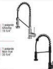
ROBINET DE CUISINE FRASER #7715/34

RABAIS DE 20% 119 20 ch PRIX COURANT 149 99 135 20 ch PRIX COURANT 169 99