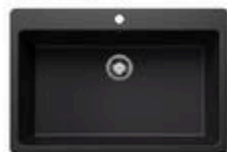
ÉVIER SIMPLE EN GRANITE LIVEN Noir, 33" x 22" x 9" #A03387

RABAIS DE 75$ 454 99 ch PRIX COURANT 529 99