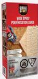
MOUSSE À PULVÉRISATION LARGE 18 ct #T2118229