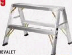
ESCABEAU/CHEVALET Aluminium Grade 1, 500 lb. 2" ALP7921