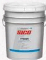
PEINTURE D'INTÉRIEUR SICO PRO COQUILLE D'ŒUF Base #2, 18,9 L #V435029

RABAIS DE 30$ 126 49 ch PRIX COURANT 156 49