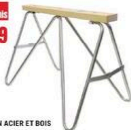
CHEVALET EN ACIER ET BOIS Plant, 36" x 30" #CHEVAL2739

PRIX sans compromis 128 00 ch ARTICLE AU CHOIX