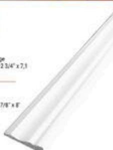
CADRAGE OU PLINTHE COLONIAL EN MDF