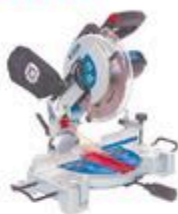
SCIE À ONGLET 10" Angles composés avec laser #E2249