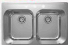
ÉVIER DOUBLE EN ACIER INOXYDABLE 3 trous, 31 1/2" x 20 1/2" #12117