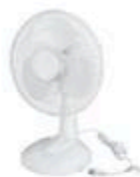
VENTILATEUR DE TABLE 12" #1334701