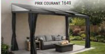
GAZEBOS MURAL FRANCFORT Alu/gris, 10' x 12' #FRANCFORT101277

RABAIS DE 350$ 1299 ch PRIX COURANT 1649