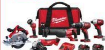
ENSEMBLE 6 OUTILS M18 Batterie et chargeur inclus #D51626