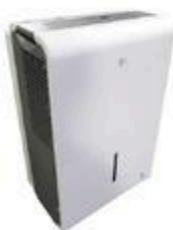
DÉSHUMIDIFICATEUR 50 pintes #11FA200