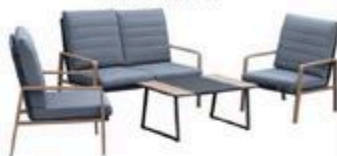
ENSEMBLE CONVERSION Aluminium et gris #F2C2231N67