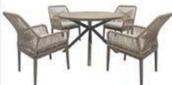
ENSEMBLE À DÎNER VIRGO ROND VIRGO