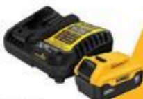
ENSEMBLE DE DÉPART 20 V MAX 5 AH #DCC255X