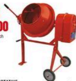
BÉTONNIÈRE PORTATIVE 3,5 pi 3 #KCT150