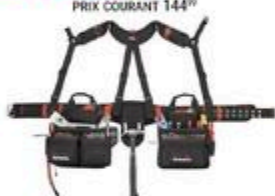
TABLIER 27 POCHES ET BRETelles #17317

RABAIS DE 20$ 124 99 ch PRIX COURANT 144 99