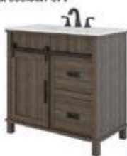
VANITÉ EN CHÊNE FONCÉ ROMANE 36" x 19" #PC6036CF

RABAIS DE 80$ 499 98 ch PRIX COURANT 579 99