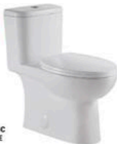
TOILETTE MONOBLOC ALLONGÉE À DOUBLE CHASSE BALI