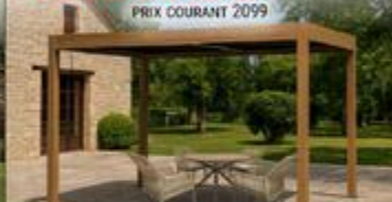
PERGOLA VIKEN 10' x 13' #VIXEN1013

RABAIS DE 300$ 1799 ch PRIX COURANT 2099