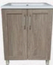
VANITÉ LAGOA Fini bois, 2 portes SHAKER, 24" #183424