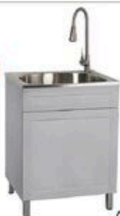
CUVE DE LAVAGE SICILY Grise, 25" x 22" x 34,5" #C00881

RABAIS DE 50$ 299 99 ch PRIX COURANT 349 99