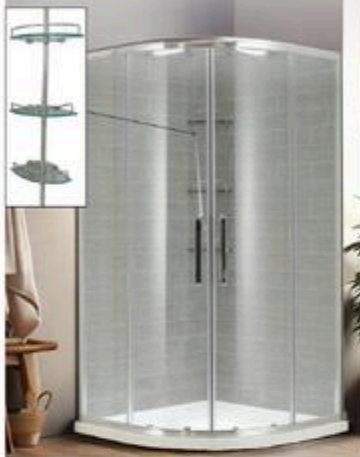
DOUCHE MANCHESTER Néon-ronde, Chrome, 38" Tablettes et murs inclus #MA260220/G

RABAIS DE 80$ 469 99 ch PRIX COURANT 549 99