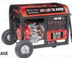
GÉNÉRATRICE À ESSENCE AVEC DÉMARRAGE ÉLECTRIQUE 10 000 W #KCG10099GE