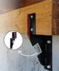
SUPPORT POUR POUTRE #N1200