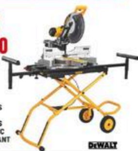
SCIE À ONGLETS RADIALE 12" À DOUBLE ANGLES COMPOSÉS AVEC CHARIOT ROULANT #D937805ST