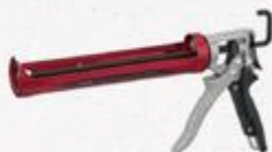
FUSIL À CALFEUTRER #DNV100P