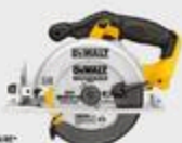
SCIE CIRCULAIRE* "CIRCULAR SAW" DSC1130 - 6-1/2" - PWA 1442-1130-1048 1278.00