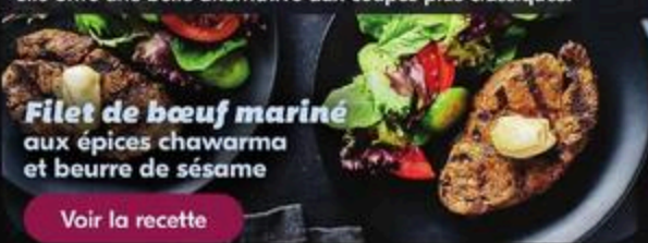
Filet de bœuf mariné aux épices chawarma et beurre de sésame

Une coupe méconnue, mais étonnamment tendre lorsqu'elle est bien apprêtée. Idéale pour mariner ou pour une cuisson contrôlée, elle offre une belle alternative aux coupes plus classiques.