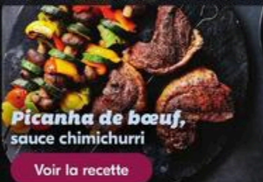
Picanha de bœuf, sauce chimichurri