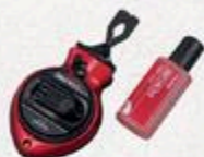
CORDEAU 100° À craie #R28214