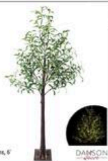
OLIVIER SOLAIRE 295 lumières DEL, 8 fonctions, 6" #A26633