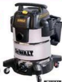
ASPIREUR POUR RÉSIDUS SECS OU HUMIDES 10 gal #D0V782

RABAIS DE 40$ 139 99 ch PRIX COURANT 179 99