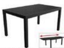
TABLE SEULE EXTENSIBLE PALMA Noire, 96" #P0Z360