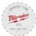
LAME DE SCIE CIRCULAIRE À CADRE DE 6 1/2" X 24 DENTS #4840322