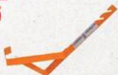
ÉTRIÈRE À TOITURE 50 DEGRÉS #74611P