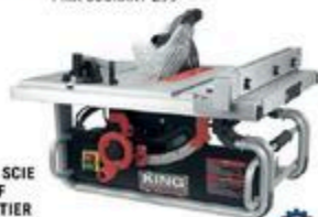
BANC DE SCIE PORTATIF DE CHANTIER 10" #A02514C

RABAIS DE 25$ 274 00 ch PRIX COURANT 299 00