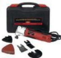
ENSEMBLE D'OUTILS MULTIFONCTIONS 30 accessoires #D44108