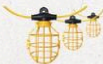
LAMPE DE TRAVAIL SUSPENDUE 14/3, 5P #L692759