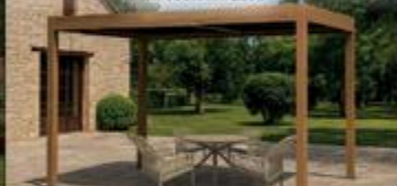
PERGOLA VIKEN 10' x 13' #VIKEN1013