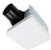
VENTILATEUR DE SALLE DE BAIN ENERGY STAR 60 PCM, 1.55 #383