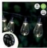
JEU DE 50 LUMIÈRES À DEL Blanc chaud #J57361