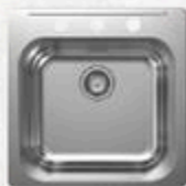
ÉVIER SIMPLE EN ACIER INOXYDABLE 3 trous, 20" x 20 1/2" #12174