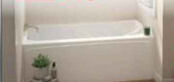
BAIN À JUPE MADDIE Blanc, Drain à droite ou à gauche, 66" x 32" #MAD4622E/C