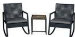
ENSEMBLE BISTRO CHAISES BERÇANTES VERSO #P1870VRS0D