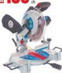
SCIE À ONCLET 10" Angles composés avec 140W #A02406