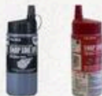
CRAIE POUR CORDEAU Noire ou rouge, Extra-fine, Semi-permanente, 10,5 oz #PLC28K300/0R200