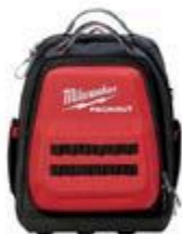
SAC À DOS PACKOUT #4822001