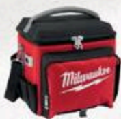
GLACIÈRE DE CHANTIER #R3226250