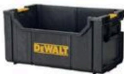
BAC DE MANUTENTION TOUGHSYSTEM™ #D09184005