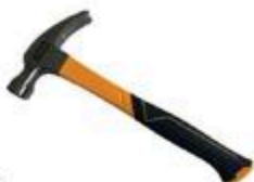
MARTEAU DE CHARPENTE Fibre de verre, 20 oz #251049