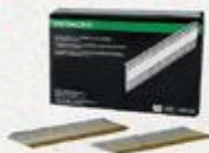
CLOUS DE CHARPENTE 30° Metabo HPT, 3 1/2" #191260P7