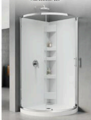
ENSEMBLE DE DOUCHE OPALINE Neo-roule, Chrome, Porte, base et panneaux murux 34" x 76" #565343C