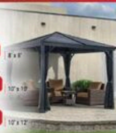
ABRI-SOLEIL VENTURA Gris #VENTURAB093-101093/101292