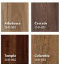
Planche de revêtement de sol en vinyle pour pose libre Rocky Mountain Résistante à l'eau. Boîtes de 23,36 pi 2 . Rocky Mountain loose lay vinyl plank flooring Water resistant. 23.36 sq. ft. cartons. 5 mm x 7" x 48"