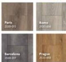
Planche de revêtement de sol stratifié Dreamfloor Classic Installation flottante. Boîtes de 13,62 pi 2 . Dreamfloor Classic laminate plank flooring Floating installation. 13.62 sq. ft. cartons. 12 mm x 4,8" x 50"

Paquet de moulure en vrac / Moulding bulk packs MDI apprêté, paquet de 10. / Primed MDF, 10 pack. Dimensions nominales montrées / Nominal sizing shown.