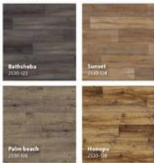
Planche de revêtement de sol en vinyle SPC Dubai Résistante à l'eau. Boîtes de 23,31 pi 2 . Dubai SPC vinyl plank flooring Water resistant. 23.31 sq. ft. cartons. 5,5 mm x 5,8" x 48"